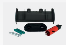
Cel-installatiekit voor 50- en 63mm-slangen