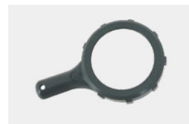
Sleutel ontgrendeling cel